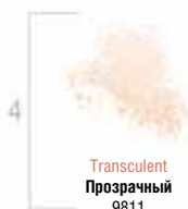
Translucent Прозрачный 9811